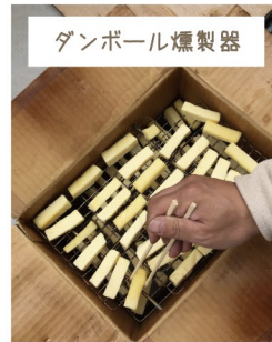
ダンボール燻製器