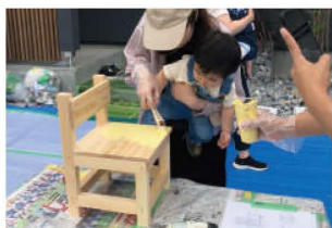
お母さんと一緒に色塗り♪