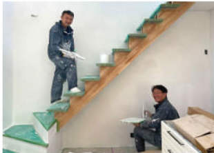
壁塗り当日の様子を写真でご紹介します♪