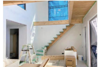
吹き抜けリビング