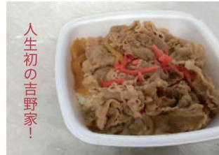
壁塗りの日のお昼ごはん