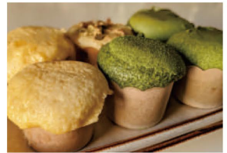
先日つくったマフィン。 カップに生地を入れすぎて 少し溢れちゃいました...