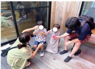
中庭でかき氷やジェラートを 食べる子どもたち。 暑い日で大好評でした！