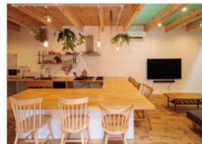
コの字型の造作キッチン

8月下旬、埼玉県三郷市にお住まいのOBさんのお家で 写真と動画の撮影をさせていただきました。 延床面積40坪の2階建てで、店舗を併設した口の字の間取り です。富澤撮影・宇都木編集のYouTubeも更新されているので、 お時間があるときにご覧ください。 お家の写真も一部ご紹介いたします→→→