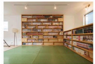
2階には大きな本棚を設置