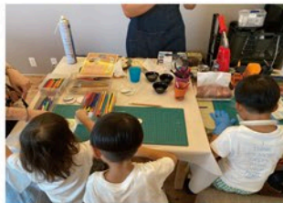
自分で絵を描いて作る、 缶バッジやキーホルダー。 すぐ身につける子も。