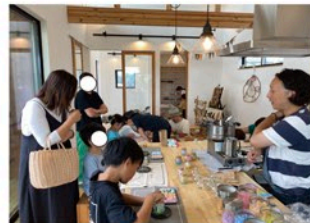
手前：アロマキャンドル作り 奥：流木を使った木工体験 自分だけのオリジナルを。