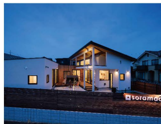
▲ライトアップした佐野モデル。玄関側も庭側もカッコいい!