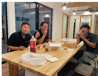
▲外構屋さんケーキをいただきました!ありがとうございます😊