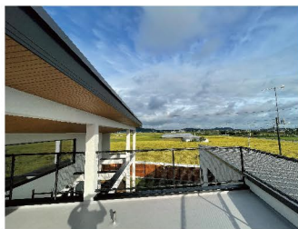
▲モデルの屋上から見える景色!山も見えて気持ちいいです♪