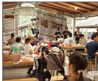
▲2016年から場所を清水公園に変更!規模もどんどん大きく!