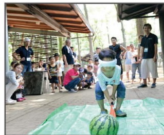
▲2018年、スイカ割りの様子。みんなで盛り上がりましたね^^