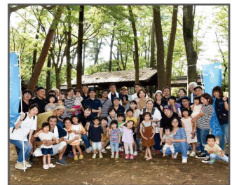
▲2019年の集合写真!BBQの最後には必ず撮影しています♪