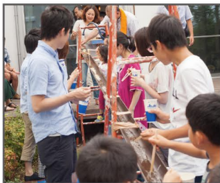
▲第一回(2014年)はスタッフ鈴木の家で開催しました♪

ソラマドでお家を建てたOBさん、おうちづくりを考えている方、そして我々スタッフが集う「そらとも会」。そらとも会では、夏のBBQと年始のお餅つきが毎年の恒例行事となっていました。ここ3年間はコロナで開催ができておらず、なんだか物足りない気持ちが続いています。そらとも会を知らない方もいると思うので、過去のBBQの様子をご紹介します!