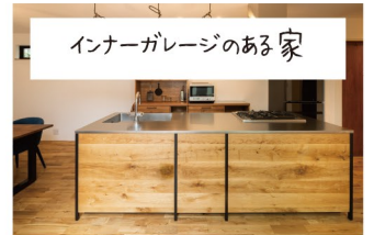
インナーガレージのある家