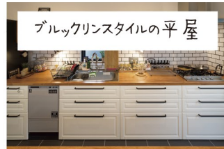
ブルックリンスタイルの平屋