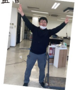
引越中の大木監督

4月からは、新入社員の現場監督仲間入りします。次回号のsoraのおとでご紹介させていただきますので、お楽しみに~☆