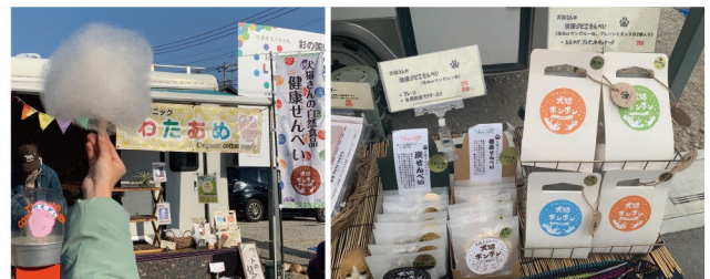
▲わっしょい農園さんは「犬猫ポンポン」というペットのための健康おやつも販売されています！