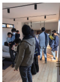
1軒につき30分を目安に、 見学をさせていただきます♪

次のバスツアーは、お家を見るだけでなく...!? いつもとは少し違う企画をしておりますので、お楽しみに♪