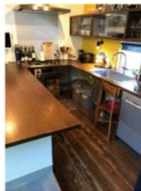
左上:中庭 右上:眺めのいい屋上 左下:コの字型キッチン

大分では、3軒のソラマドを見学しました。 中でも印象的だったソラマドは、中庭の横を通って玄関に入る間取り。(左上写真参考) 玄関に入る前から、中庭を通して部屋全体が見えるので、家の中の人も家に帰ってくる人も家族を感じることが出来ます。 その他にも、コの字型キッチンや見晴らしのいい屋上等、ワクワクポイントがたくさんありました♪