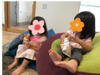
おそろいのお菓子を食べながら、 仲良くDVD鑑賞♪

先日、モデルハウスにて、同じ時間帯にお打合せをしていたお客様のお子様同士と一緒に遊んでいたのですが、、、 同じくらいの背丈、ミディアムヘア、ピンクのお洋服と後ろ姿がそっくりな2人!