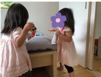
ベッドの上に何かを発見した様子、 なにやら二人でお話しています