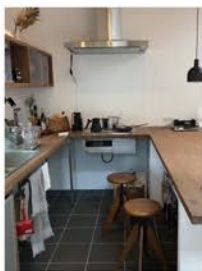
左上:漆喰の壁 右上:広々ウッドデッキ 左下:コの字型キッチン

福岡のソラマドは、漆喰の壁が特徴的でした。 埼玉は比較的ツルっとした見た目の壁になるのに対し、福岡のソラマドの壁は職人さんによるコテ跡がしっかり残されている波模様。 陽の光による漆喰の陰影を、より楽しめそうだなあと思いました。 その他にも、コの字型キッチンや広々としたバルコニー、土間から続く中庭等、魅力がたくさん詰まっていました◎