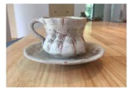
マイカップでちゃっかり試飲♪

イベント期間中、今回特別に作ったソラマドのオリジナル珈琲「ソラマドブレンド」を目 当てに来場して下さったお客様もいらっしゃいました！ 嬉しくなって早くも、第二弾を企画中です！またのご来場をおまちしております◎