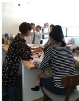
同じポーズのSさんご夫婦♪