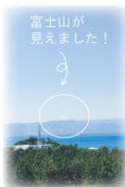
富士山が見えました!

たものの、この日は東京でも気温が27度。海に囲まれた初島はもう夏です! 4kmとはいえ、直射日光の下だとあっという間にエネルギー不足に(笑)ということで、島到着から1時間も経たないうちに、休憩できる