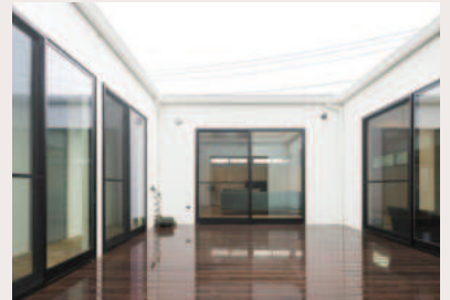
※写真は間取りが似ている別の物件です

ホワイトの塗り壁で仕上げた外観。中庭をぐるりと囲む「口」の字型の間取りです。すべての部屋が中庭に面していて開放感抜群。それでいて外部の目を気にせずプライバシーをしっかりと守ります。趣味&書斎部屋や畳コーナーも完備しました。