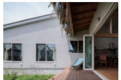
※写真は間取りが似ている別の物件です

グリーン色の塗り壁で仕上げた外観。広いお庭を囲む「コ」の字型の平屋です。玄関入ってすぐリビングの間取りで、LDK全体の天井が勾配になっています。お庭はウッドデッキと土のスペースに分かれていて多用途に活用できます。