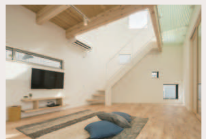
※写真は間取りが似ている別の物件です

ブラックの塗り壁で仕上げた外観。玄関を入ると広々とした5帖の土間が出迎えます。土間からパントリーを経由してキッチンまでウォークスルーできる便利な間取り。リビングは吹き抜けで、大容量の収納も備えた家事がしやすい住まいです。