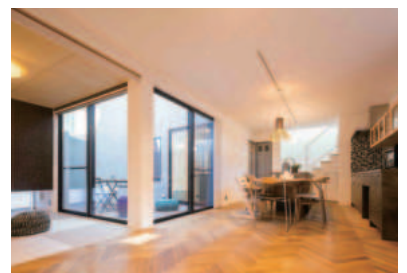
※写真は今回の見学会場です

グレーの塗り壁と木製サイディングを組み合わせた箱型の外観。ウッドデッキの中庭を「コ」の字型に囲む間取りです。LDKの床には無垢材のヘリンボーン張りを採用し、グラフィックキッチンとの相性抜群。こだわりの設備や仕様も見所です!