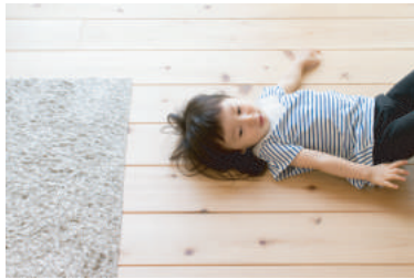
自然の素材を使って

大切な家族が暮らすところだから床や壁を体に優しい素材に。無垢の床は、冬は暖かく夏はサラッと。家に帰る度、木の香りがするの心地いい。