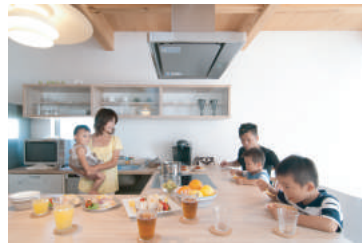
ソラマドキッチン

子どもたちが小さいうちは一つのお部屋で皆で遊ぼう。大きくなったら、その時に仕切るか考えよう。成長していく家族に合わせて家も一緒に進化していこう。