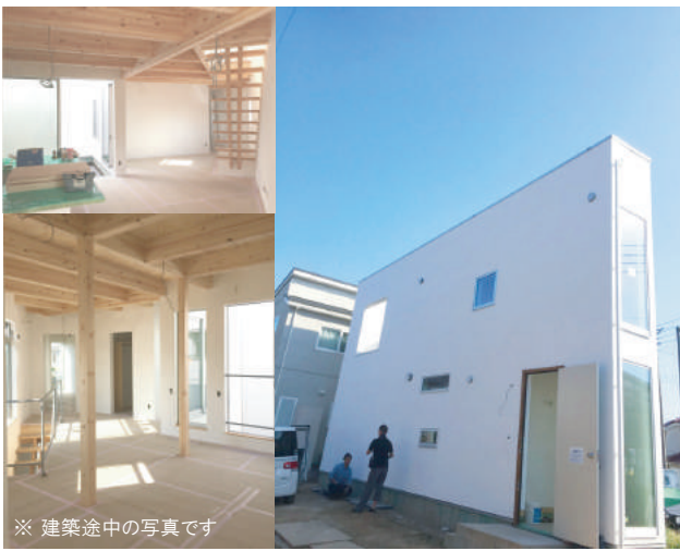
※ 建築途中の写真です

43坪の三角形の土地に建ったソラマドの家。一見難しそうなお家でも、中庭や空の見えるお風呂など憧れていた暮らしを実現！