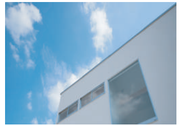
たっぷりの太陽の光

家族が自然と集まるキッチン。家事もやすく、リビング空間も広く使える。子どもたちがお手伝いをしたり、宿題をしたり、家族との絆を育む不思議なキッチン。