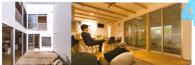
草加市 K 邸

お砂場遊びに、自転車に、沢山のおもちゃも4.5畳の大きな土間があれば心配なし。室内に上がる2つの上り口は、手前が重たい買ひ物袋を冷蔵庫の前における入り口。奥は、脱いだコートもすぐにしまえる収納付きの入り口。家事の負担を減らし、子どもたちと伸び伸びと暮らせるように便利さとスッキリを両立した、ママにやさしいS邸。