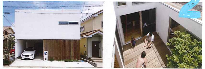
草加市 Y 邸

お家のテーマは、AsianResortBali。タイル張りの中庭や、ブラウンを基調とした色合いでキッチンカウンターや床を統一し、落ち着いた雰囲気。暮らしの中に、非日常のリゾートが自然と溶け込んだ大人のソラマドです。