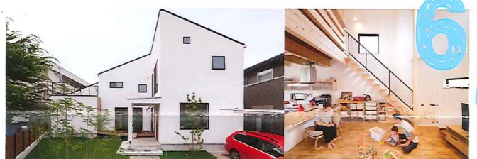
草加市 K 邸

遊びどころを取り入れながらも、家事導線にとことんこだわったK様邸。何度も悩んで決めた、キッチンからサニタリーへの中間にはウォークインクローゼットを配置。家事に仕事に忙しい奥様のアイデア満載です。2階の勾配天井となっているフリースペースは、お子さんの遊び場。手作りの滑り台は、大のお気に入りとして、屋根の勾配を利用してつくったロフトは、ご主人のこだわりの「書斎」となっています。