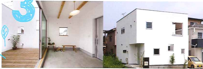
川口市 S 邸

子どもたちが、ぐるぐると走り回れるコの字型のお家。シンボルツリーのある中庭は、お子さまにとっておきの遊び場。かけっこしたり、シャボン玉をしたり、色々な遊びが生まれる場所です。