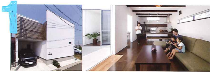
草加市 O 邸

お家のテーマは、AsianResortBali。タイル張りの中庭や、ブラウンを基調とした色合いでキッチンカウンターや床を統一し、落ち着いた雰囲気。暮らしの中に、非日常のリゾートが自然と溶け込んだ大人のソラマドです。