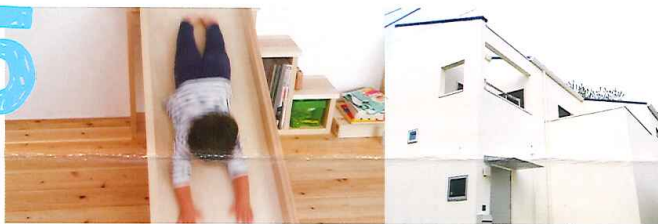
草加市 K 邸

描いてきた憧れの暮らし。雑誌や、HPで見つけた“あっぱいな”を自分たちに合わせた形で実現したK邸。中庭や室内の壁をスクリーンにして、2人の好きな映画やアーティストのDVDを流したり、サッカーの試合の日には沢山人が集まって皆で観戦を楽しんだり。キッチンのカウンターは2人の時も、大勢の時もどちらの時も楽しめるように大きさを変えられる工夫をしました。