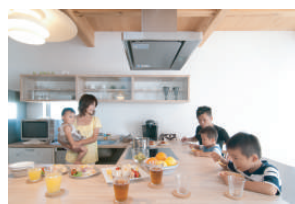
ソラマドキッチン

子どもたちが小さいうちは一つのお部屋で 皆で遊ぼう。大きくなったら、その時に 仕切るか考えよう。成長していく家族に 合わせて家も一緒に進化していく。